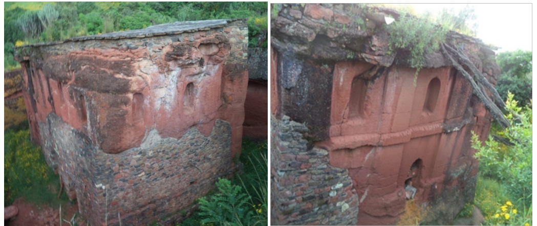
ብርሃነ ምስል ፩. የሰሜንና ምዕራብ ገጽ እይታ፣ ብርሃነ ምስል ፫. የምሥራቅ ገጽ እይታ

ቅርጽ ያለው ጥንታዊ የሥልጣኔ አሻራን የሚመሠክር ሙሉ ወጥ ወቅር ሕንፃ ሲኾን በውጭ በኩል ፲፭ ሜ. ርዝመት፣ ፲ ሜ. ወርድና ፲ ሜ. ቁመት አለው፡፡ ሕንፃው በሁሉም ገጽ ከዋናው ዐለት ሲኾን የሐናዕያኑን ልዩ የምሕንድስና ጥበብና ችሎታ የሚያሳዩ የውኃ መፋሰሻ እንዲሁም የሰው መተላለፊያ የነበሩ መሸለኪያዎች በደቡብ ምዕራብ (በስርቆት ምክንያት በቅርብ ጊዜ ተዘግቷል) እና በሰሜን ምሥራቅ ገጽ በኩል ይገኛሉ፡፡ የደብሩ አገልጋዮች እንደሚሉት መሸለኪያዎቹ በእግዚአብሔር ርዳታ ከዙጋ ወንዝ ተጠልፎ የመጣ ውኃ የሚገባቸውና የተቆፈረውን አፈር እያጠበ የሚወጣቸው ነበሩ፡፡ 58 ቤተ ክርስቲያኑ ዙሪያውን በዐለቱ ገደልነት የታጠረ ሲኾን አንድ መግቢያ ብቻ አለው፡፡ ይህም ቅርብ ጊዜ የተዘጋጀ እንጅ የመጀመሪያው በር አይመስልም፡፡ ምክንያቱም የመጀመሪያው በር የተዘጋው መሸለኪያ ሳይኾን አይቀርም፡፡