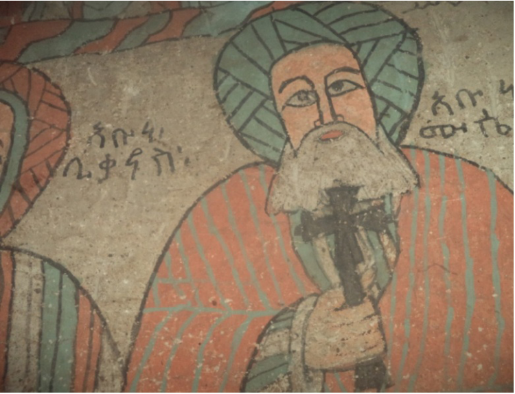
ሥዕል ብርሃን ፤ የአቡነ ሙሴ ሥዕል (የድባ ማርያም ግድግዳ ላይ ከተሣለ ሥዕል የተወሰደ)

ሥርግው 27 እንደገለጸው የአምስተኛው መ.ክ.ዘ. የኢትዮጵያ ክርስትና ኹኔታ ግልጽ ኾኖ አልታወቀም። የአቡነ ሙሴ ታሪክ በውል አለመታወቁም ከዚህ ጋር የተያያዘ ነው። አቡነ ሙሴ ወደ ኢትዮጵያ የመጡት በአብርሃና አጽብሐ ዘመን መንግሥት መኾኑን ገድላቸው ይገልጻል። ወደ ኢትዮጵያ ሊደርሱ የሚችሉት በዐራተኛው ክፍለ ዘመን መጨረሻ አካባቢ ይመስላል። አብርሃ ከአጽብሐ ቀደም ብሎ በ፴፻፶ዎቹ ዐ.ም አካባቢ ሳያርፍ አይቀርም። ስለዚህ በትረ መንግሥቱ በአጽብሀ እየተመራ ቆይቷል ማለት ነው። ፡ አቡነ ሙሴ የመጡት አብርሃ ካረፈ በኋላ የመንግሥቱ አስተዳደር በአጽብሐ ወይም እነርሱን በተካቸው መሪ እየተመራ በነበረበት ጊዜ ሊኾን ይችላል። ገድላቸው ጊዜውን ከአብርሃና ከአጽብሐ ዘመን መንግሥት አገናኝቶ መጥቀሱ ለዚህ ሳይኾን አይቀርም። በጥቅሉ አቡነ ሙሴ ሚናስ ወይም ዳግም ሰላማ በመባል ይታወቁ ነበር።