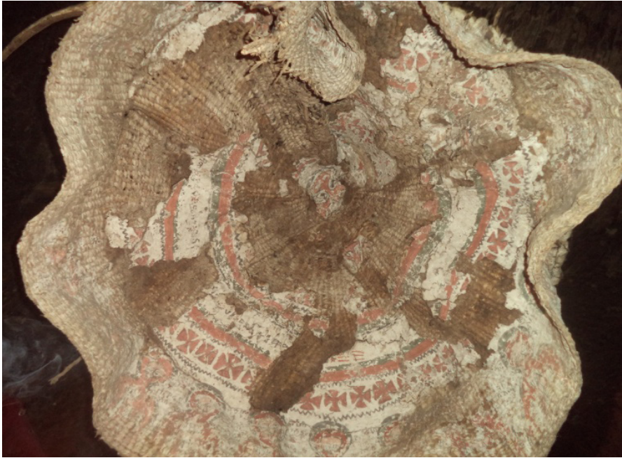
ሥዕል ብርሃን ፮. የድባቡ ውስጣዊ ዕይታ

እነዚህ ቅዱሳት ሥዕላት ቀለማቸው እየለቀቀና የጃንጥላው ጌጣጌጦችም በጊዜ ብዛት እየረገፉ ትውልድ ሳያውቃቸው ሊጠፉ መኾናቸውን ለሚመለከት ጥልቅ ንዝንን ይፈጥራል። የድባቡን ውጫዊ ክፍል ባለው ኹኔታ ለመረዳት አስቸጋሪ ነው። ቀለም የተቀባ እንደነበር አመላካች ነገሮች አልፎ አልፎ ቢታዩም አንድም የሥዕል ምልክት አልተገኘም። በርግጥ ውስጣዊ ክፍሉን በሥዕላት እንዳስገኙት ውጫዊውንም በተመሳሳይ ኹኔት ሳያስገኙት አይቀርም። በሌላ በኩልም በድባቡ ውስጣዊ ክፍል የጅውን ቅዱሳን ኹሉ ለመሣል ስለማያስችል ውጫዊው የድባቡ ክፍል ሥዕላት ተሥላውበት እንደነበር መረዳት ይቻላል። ይኸ ድባብ በአቡነ ሙሴ ጊዜ እንደተሠራና ከጊዜ ብዛት የተነሣ እየደበዘዘ መምጣቱ እንጂ ብርሃን ይሰጥ እንደ ነበር ሊቃውንቱ ይናገራሉ። እስከ ሣራ ድረስም አገልግሎት እየሰጠ ያለ ጥንታዊ ቅርስ ነው። በአጠቃላይ በየትኛውም አካባቢ ሊገኝ የማይችል የሀገራችንና የቤተ ክርስቲያናችን ብቸኛው ቅርስ ነው ብሎ ማለፍ ይቻላል።