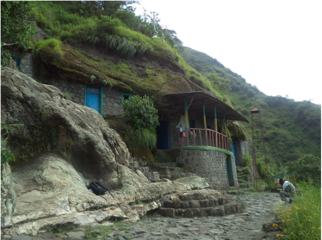
ሥዕለ ብርሃን ፬. የዐዲስ አምባ ዋሻ መድኃኔ ዐለም ገዳም፣ ከፊል ዕይታ