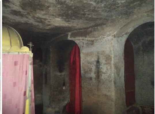
ሥዕለ ብርሃን ፮ (በስተግራ). መስቀለኛ መስኮቶች፣ በስተምዕራብ ወደ ቅድስቱ ክሚያስገዛው በር አናት ግራና ቀኝ