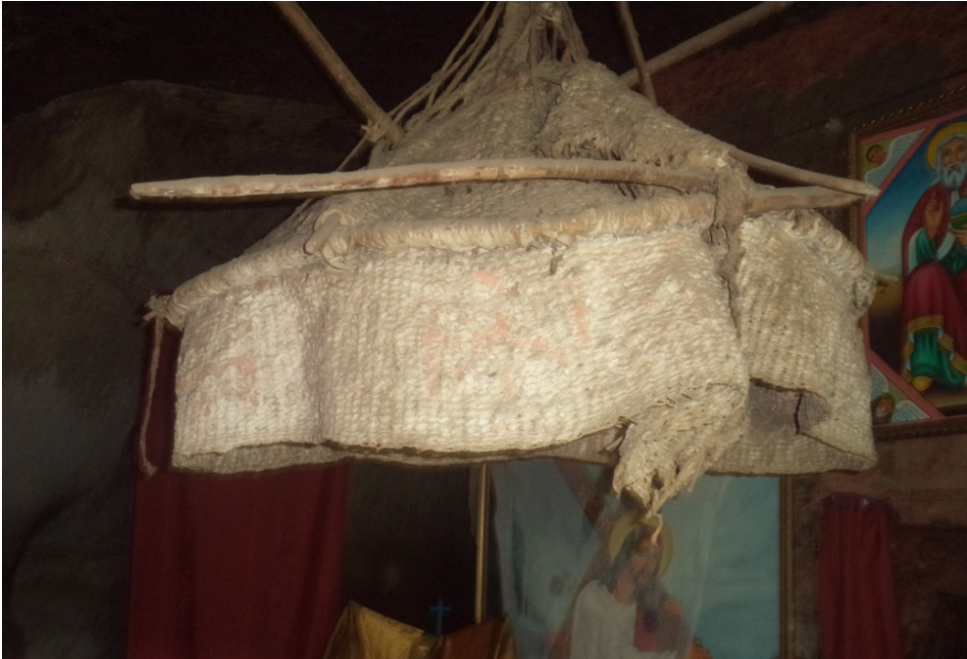
ሥዕል ብርሃን ፭. ዐዲስ አምባ መድኃኔ ዐለም የሚገኝ ከዛፍ ልጥ የተሠራ ጥንታዊ ድባብ

ወደ ቅኔ ማኅሌቱ ሲገቡ ቀድሞ ለዐይን ዕይታ የሚገባ የሰው ልጆች ፈጠራ የተገለጸበት ድንቅ የጥበብ እድ ውጤት ጣራው ላይ ተዘርግቶ እንመለከታለን። ይኸም ከቅኔ ማኅሌቱ ጣራ ላይ የተንጠለጠለ ዕድሜ ጠገብ ድባብ ነው። ይኸን ድባብ የጥበብ እድ ውጤት መኾኑ ሲገለጽ ዐዲስ ነገር ሊኾን እንደሚችል አስባለሁ። ድባቡ በወርቅ የተጌጠ ወይም ከጨርቅ መሰል ነገሮች የተሠራ አይደለም። እንዲኸ ከኾነ አስደናቂነቱ እምብዛም ሊኾን ይችላል። ምክንያቱም በወርቅ የተሸለሙ ለነገሥታትም (ወይም ለንግሥታት) ይኹን ለቤተ ክርስቲያን አገልግሎት ይሰጡ የነበሩ ቆየት ያሉ ድባቦችን ጥቂት በማይባሉ ጥንታውያን ገዳማትና አድባራት ማግኘት እንችላለን። ድባቡ በዐይነቱ እጅግ ለየት ያለ የሚያስብሉት ነገሮች የተሠራበት ቁስ፣ የአሠራር ጥበብና በውስጡ የሚገኙ ጥንታውያን ሥዕላት ናቸው። ድባቡን ለመሥራት አገልግሎት ላይ የዋለው የዛፍ ልጥ ነው። በእጅ ጥበብ ሙያ በመታታት (ልጡን በማጠላለፍ) የተሠራ ነው።