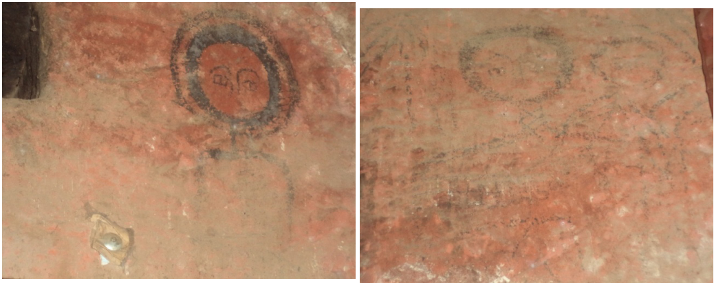
ሥዕል ብርሃን (፱፣ ፲). ከገዳሙ ዋሻ ውስጥ የሚገኙ የግድግዳ ላይ ሥዕላት

ከጎንደር ዘመን በፊት የተሣሉ መኾን አለባቸው። ሥዕላቱ የሚወክሉትን ቅዱስ መለየት አስቸጋሪ ነው።