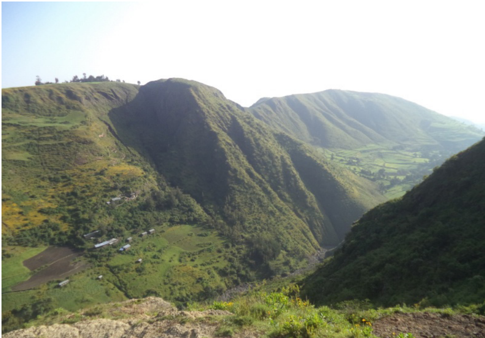
ሥዕል ብርሃን ፩. የገዳሙ አካባቢያዊ ገጽታ-ክደብ በኩል በርቀት ሲታይ