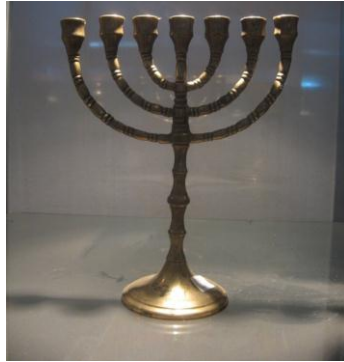
ስእል 1 ማኅቶት

የሚበራው ቀንዲል ወይም ሻማ ሲኾን ይችላል። በብሉይ ኪዳን ሙሴ እንዲሠራቸው ከታዘዛቸው ሦስት ንዋያተ ቅድሳት አንዱ ነው 70 ። ተቋመ ወርቅ የተባለው የሚበራው በዘይት ስለነበረ አሠራሩም ከወደታች ቀጥ ብሎ እንዲቆም እንደ ጽዋዕ ያለ እግር ይሠራለታል። መካከለኛውን አንድ ወጥ አድርጎ እንዲያበጅና ሦስቱን የመቅረዙን ቅርንጫፎች ከግራና ከቀኝ በማድረግ በመካከለኛው ላይ የተሞላውን ዘይት በስድስቱም እንዲሞላ መኮስተሪያ እንዲያበጅለት አሟሏል። ምሳሌነቱ ተቋሙ የድንግል ማርያም፣ ፊትሉ አምላክ የነሣው ሥጋ፣ ዘይቱ የመንፈስ ቅዱስ እሳቱ የመለኮት ቅርንጫፎቹ ሰባት መኾናቸው የፍጹምነት ምሳሌ ነው። ሰባት በዕብራውያን ፍጹም ነው 71 ። በቀኝና በግራ ሦስት ሦስት መኾናቸው በዘመነ መሳፍንት፣ በዘመነ ነገሥት፣ በዘመነ ካህናት የተጻፉ መጻሕፍት ምሳሌ ነው። የተቋመ ማኅቶት ቅርጽ ከላይ በተሰጠው ማብራሪያ መሠረት የሚከተለውን ይመስላል።