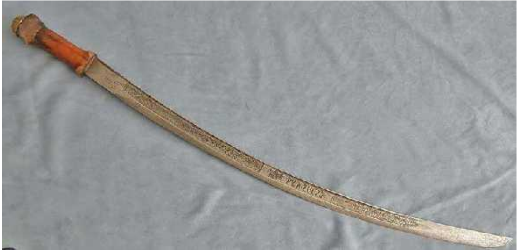
ጊሥዕል ፪፡- የቅዱስ ጊዮርጊስ ስም የተጻፈበት ሰይፍ