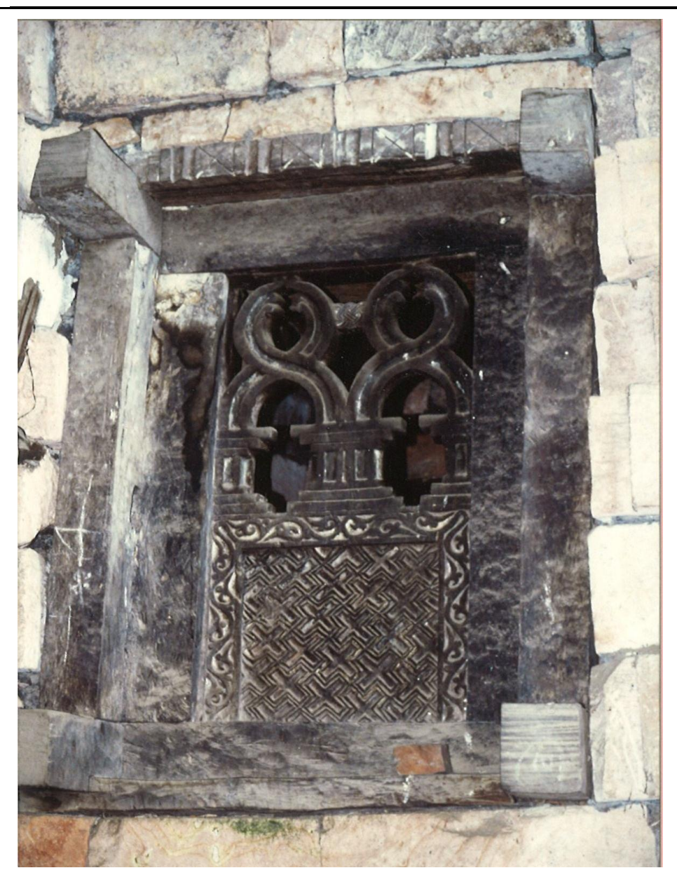
One of the three windows at the backside of the Church

There are some arguments that might be used to argue for an early construction. One of the most important arguments is that Wallie Iyesus is built deep inside a cave - big and wide enough to allow light but fully protected from rain and wind. It is fully possible to argue that