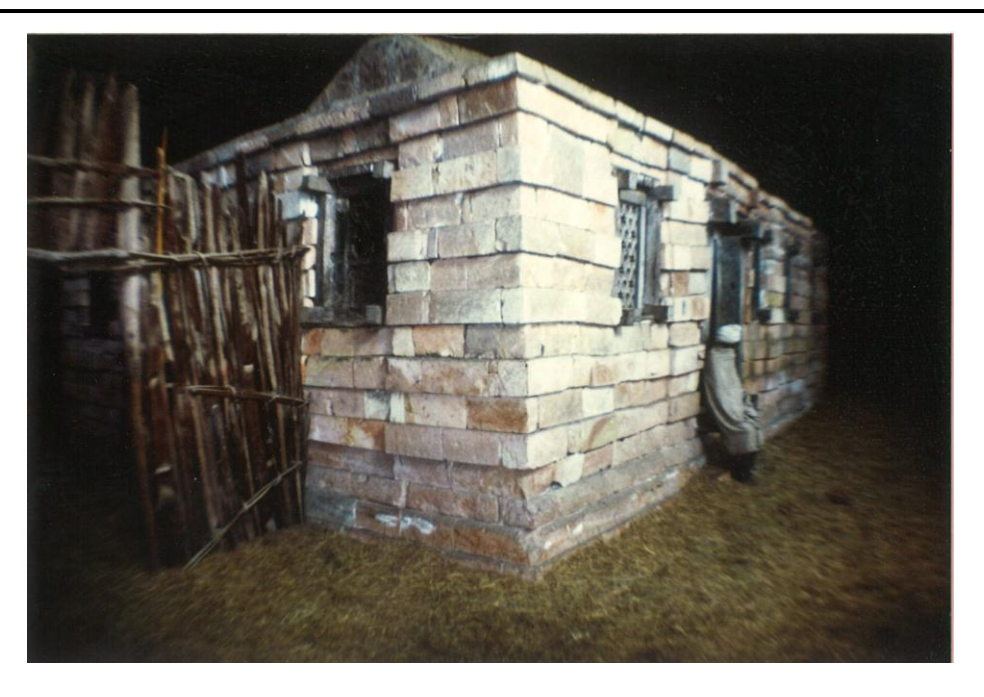
The main entrance to the church with the dome over the sanctuary