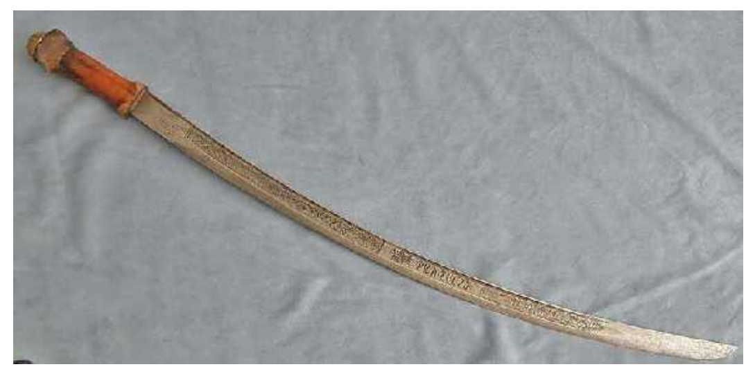
2ሥዕል ፪፡- የቅዱስ ጊዮርጊስ ስም የተጻፈበት ሰይፍ