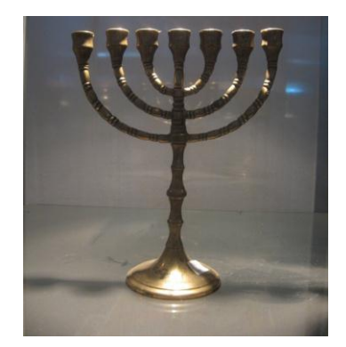
ስእል 1 ማኅቶት

የሚበራው ቀንዲል ወይም ሻማ ሊኾን ይችላል፡፡ በብሉይ ኪዳን ሙሴ አንዲሥራቸው ከታዘዛቸው ሦስት ንዋይተ ቅድሳት አንዱ ነው<sup>70</sup>። ተቋመ ወርቅ የተባለው የሚበራው በዘይት ስለነበረ አሥራሩም ከወደታች ቀጥ ብሎ እንዲቆም እንደ ጽዋዕ ይለ እግር ይሥራሊታል፡፡ መካከለኛውን አንድ ወጥ አድርሞ እንዲያበጅና ሦስቱን የመቅረዙን ቅርንጫፎች ከግራና ከቀኝ በማድረግ በመካከለኛው ላይ የተሞላውን ዘይት በስድስቱም አንዲሞላ መኮስተሪይ እንዲያበጅለት አዟል፡፡ ምሳሌነቱ ተቋሙ የድንግል ማርይም፣ ፌትሉ አምላክ የነሣው ሥጋ፣ ዘይቱ የመንፈስ ቅዱስ እሳቱ የመለኮት ቅርንጫፎቹ ሰባት መኾናቸው የፍጹምነት ምሳሌ ነው፡፡ ሰባት በዕብራውይን ፍጹም ነው<sup>71</sup>፡፡ በቀኝና በግራ ሦስት ሦስት መኾናቸው በዘመነ መሳፍንት፣ በዘመነ ነገሥት፣ በዘመነ ካህናት የተጻፉ መጻሕፍት ምሳሌ ነው፡፡ የተቋመ ማኅቶት ቅርጽ ከላይ በተሰጠው ማብራሪይ መሥረት የሚከተለውን ይመስላል።