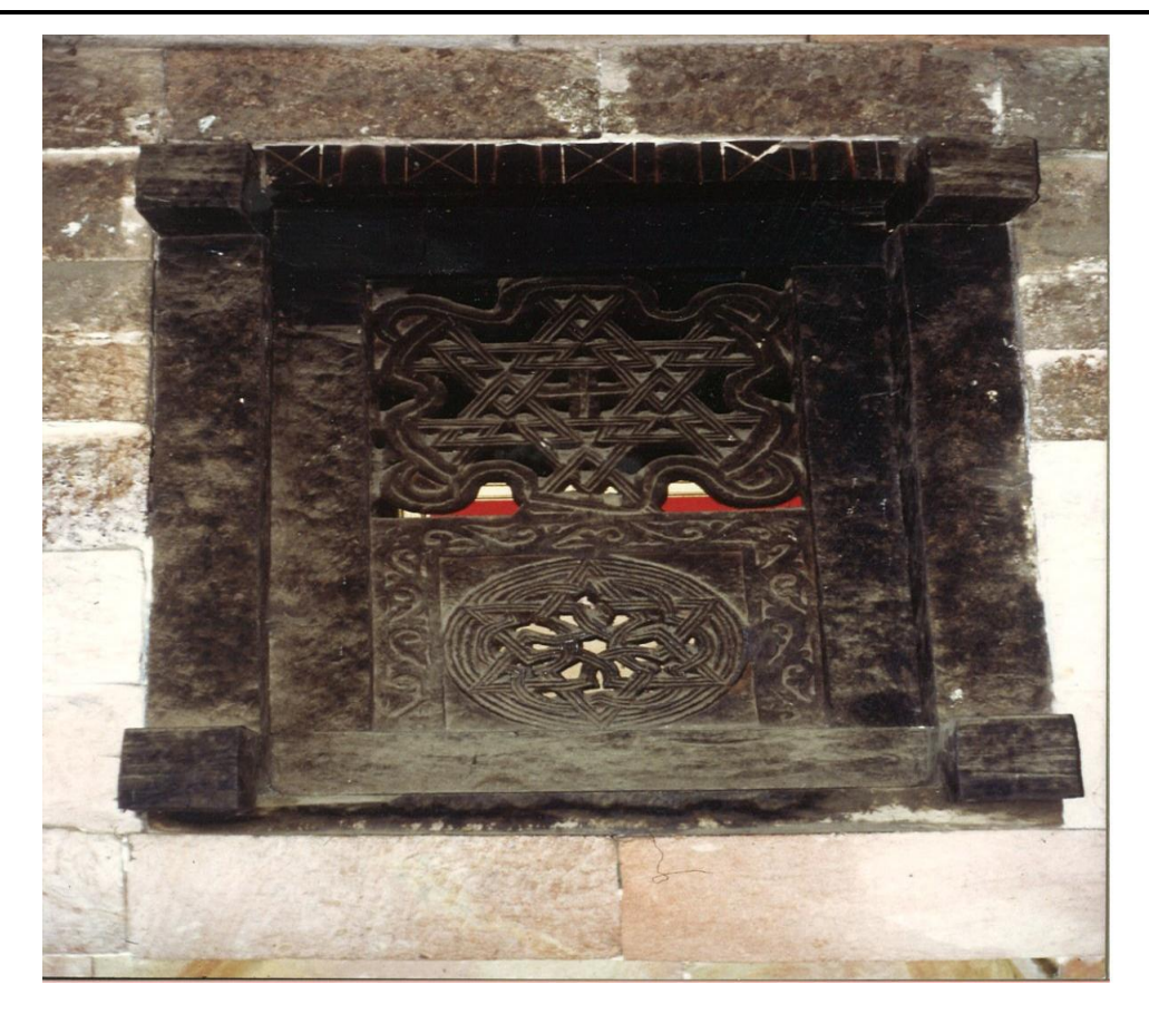
One of the three windows at the backside of the Church